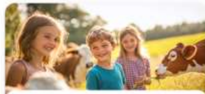
День на ферме