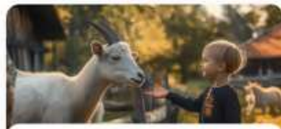
Экскурсии на ферме