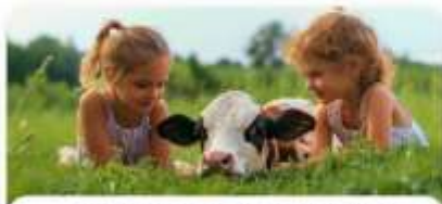
Встреча с животными